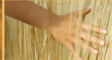
WIE SPÜRE ICH DEN HEILIGEN GEIST?