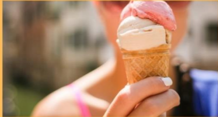
WIE SCHMECKT EIGENTLICH GOTT?