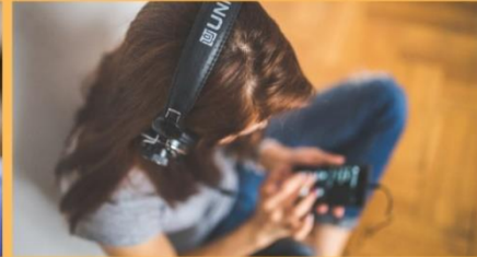
WIE KANN ICH JESUS HÖREN?